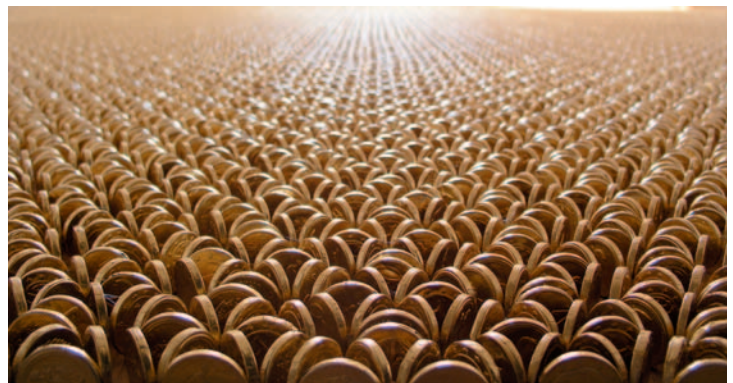
Dagmar Hugk · ortung III