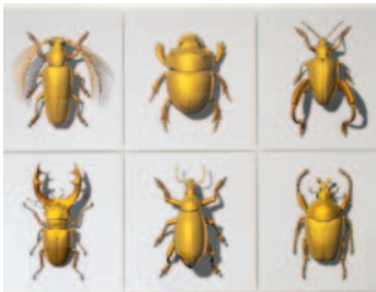
Volker Leyendecker · ortung V

Spannend und unverbraucht bleibt das Motto der Biennale: »Im Zeichen des Goldes«. Seit ortung-Beginn gehört die Beschäftigung mit dem Thema Gold – im engen und weiteren Sinn – für alle teilnehmenden Künstlerinnen und Künstler zum Standard, aus gutem Grund. Denn Gold, speziell Blattgold, hat in Schwabach eine lange Tradition. Bis heute prägt die Blattgoldherstellung Schwabachs Selbstverständnis als Goldschlägerstadt. Sie hat der Stadt weltweites Ansehen beschert.