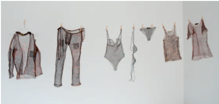
Renate Höning · ortung VI